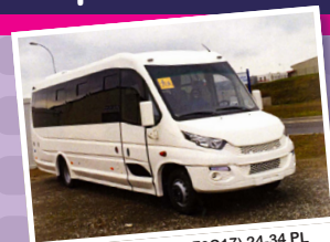
Sunrider (Iveco Daily 70C17) 24-34 PL