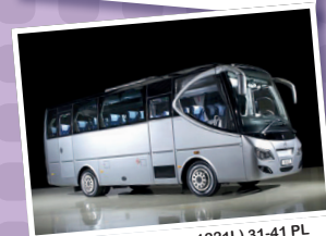
Sundancer (MB Atego 1221L) 31-41 PL