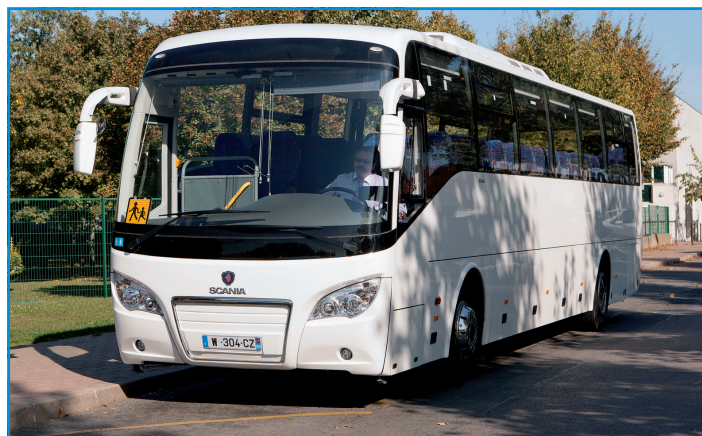
L'A30 de Higer est le choix de Scania France pour l'activité scolaire (en 3 longueurs avec des aménagements de sièges de 53 à 61 places selon les longueurs).