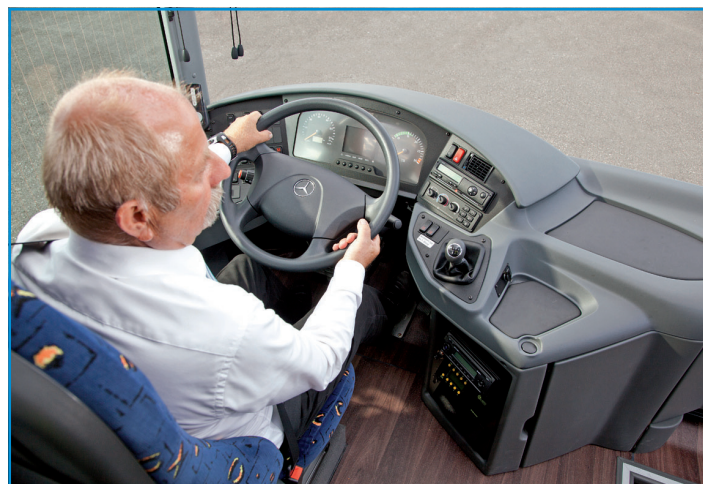
L'Intouro de Mercedes existe en 3 longueurs. Le poste de conduite est bien conçu avec le levier de vitesses intégré à la planche.

Le plus long est l'Intouro L Ecolier de 13,32 m aménagé en 61 places + 1 (tous les véhicules étant dotés de portes doubles en partie médiane et pré-équipés pour accueillir une plateforme UFR).