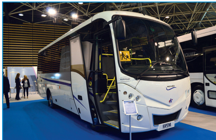
HCI importe désormais le Kapena Movéo de 34 ou 38 places réalisé sur châssis Iveco.

L'interurbain King Long Citeor importé par HCI est également un car scolaire idéal.