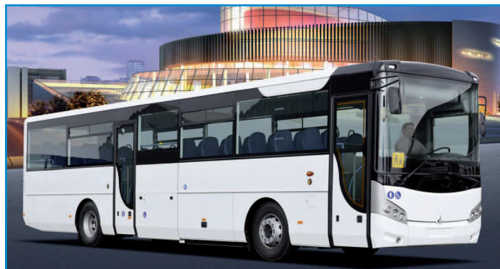
Le Starter S de Fast Concept Car est disponible en 12 et 13 m avec des sièges allant de 55 à 63 (selon le choix de l'UFR complet).

13 m avec des capacités de 59 et 63 sièges respectivement (dont 2 PMR) si prédisposition UFR. Le Starter S est aussi proposé avec le lift UFR (Starter S UFR complet).