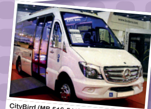
CityBird (MB 516-519) 17 + 6 PL