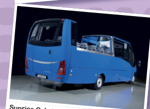
Sunrice Cabrio (Iveco Daily 70C17) 32 PL