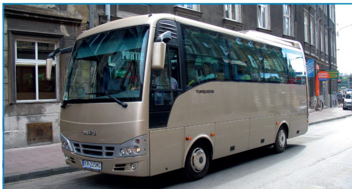
Chez Isuzu, Fast commercialise le Turquoise (ci-dessus), mais aussi le Novo et le Visigo