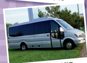
Sunset S5 (MB 519 Sprinter 16-22 PL)