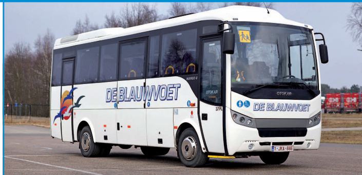
Le Navigo U SH Scolaire est disponible en 8,39 m avec une capacité de 37 sièges + 1.