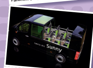
Sunny (MB 313-316 Sprinter) 9 PL