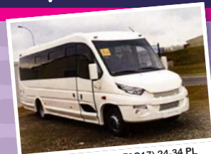
Sunrider (Iveco Daily 70C17) 24-34 PL