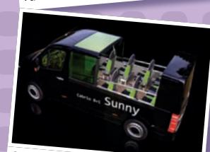
Sunny (MB 313-316 Sprinter) 9 PL