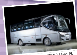
Sundancer (MB Atego 1221L) 31-41 PL