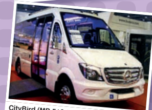
CityBird (MB 516-519) 17 + 6 PL