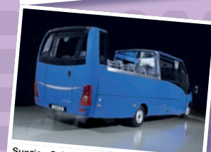
Sunrice Cabrio (Iveco Daily 70C17) 32 PL