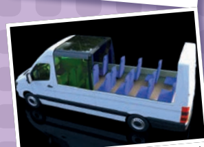
Panoramique (MB 516-519 Sprinter 20-22 PL)