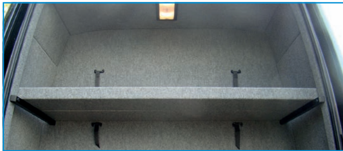
Photos ci-dessus et ci-dessous : le MidEuro de VDL est aménagé avec un coffre à bagages de 2,56 m 3 avec séparation et éclairage en partie supérieure et sur les côtés, ainsi que des sièges inclinables avec poignées, tablettes, filets...